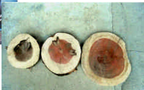
スギノアカネトラカミキリの被害を受けた樹幹断面、右の木は正常