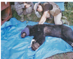
ミツバチ養蜂箱を襲ったクマを生け捕り