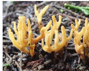
ホウキタケ類の仲間