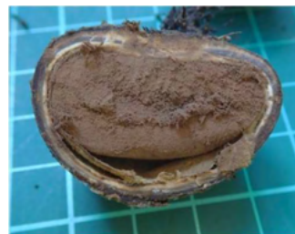
ツチグリ …… 袋の中は孢子塊で一杯