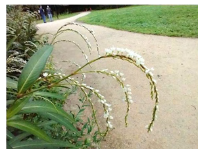
シロバナサクラタデ