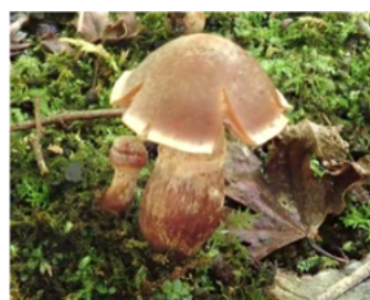
キョウケンジの仲間

最初に座学としてキノコ観察の心得(マナー)、キノコの役割、見分け方について説明受け、早速きのこを探しに。まず広場のトイレ手前では春に沢山のツチグリがあった所で、探してみると固めの袋状のものを発見。中を切ってみるとぎっしりつまった黒い孢子塊がみられ、もう、来春の準備ができているのにはびっくりです。隣の鹿柵内では「先生！ここにもこんなキノコが」と声が上がり、先生も大忙し。同定は更に吟味が必要とのことでしたが、ヌメリガサ科、ホウライタケ科・タマチョレイタケ科・フウセンタケ科・シロソウメンタケ科などなど沢山の可愛いキノコに出会えました。