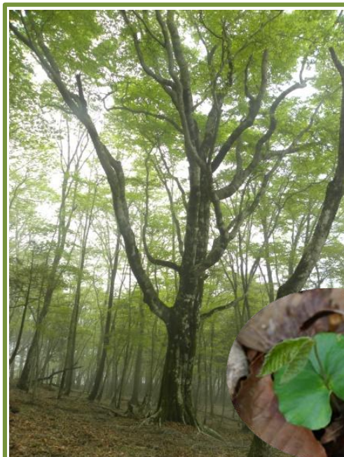
植物班が命名の2代目マザーツリー

桧岳雨山稜線のブナ調査(植物班) 丹沢のブナは斜面地に生育していて、1980年代に立枯れが目立つようになりました。衰退は、大気汚染の影響、病害虫や土壌の乾燥化など複合的な要因と考えられています。