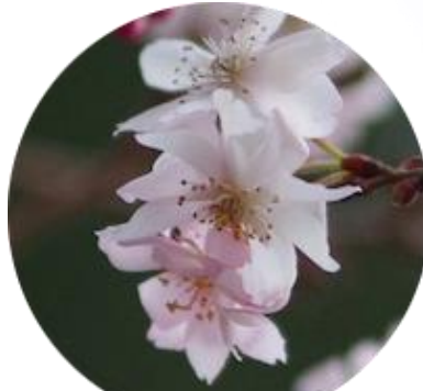
ジュウガツザクラ