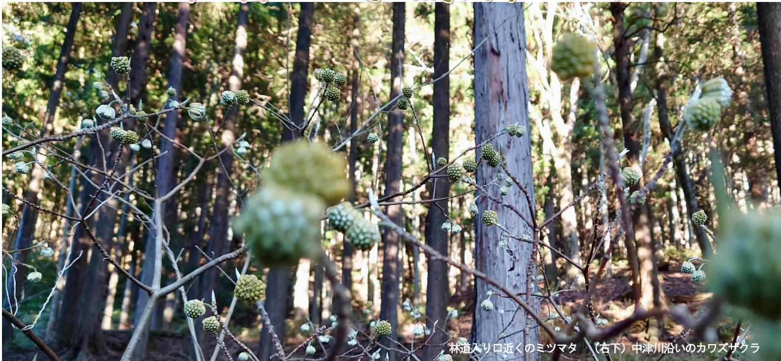
林道入り口近くのミツマタ (右下) 中津川沿いのカワズザクラ