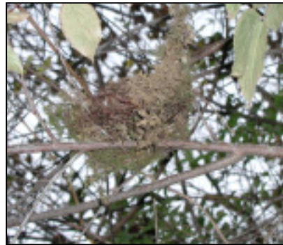
☆苔と小枝で作られた鳥の巣。上の枝から落ちた様。落葉で、隠れていた巣が現れます。