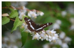
イチモンジチョウ・右表・左裏