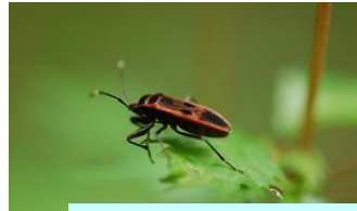
ヒメホシカメムシ