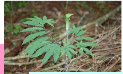
ホソパテンナンショウ