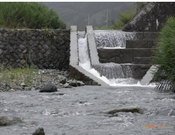
ヤドリキ沢から中津川さらに川音川、酒匂川となり、飯泉取水場で採水されます。(中津川の魚道がある堰)