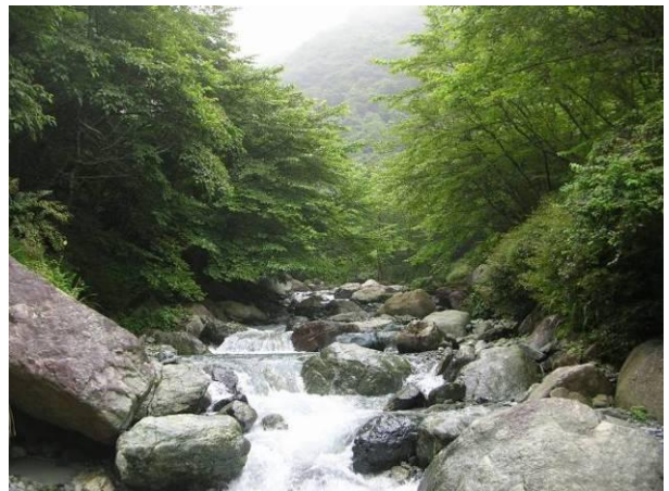
上の写真はやどりき水源林の名所である〔滝郷の滝〕です。 下は林道コースに沿って流れている溪流で、周囲の緑と少し青っぽい水が大変きれいです。