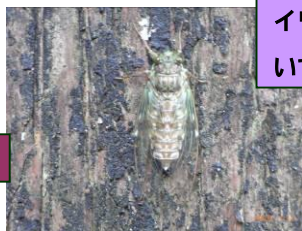
ヒグラシがよく鳴いています