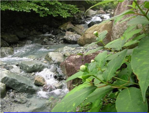
溪流とタマアジサイ。咲くのが楽しみです。(上)