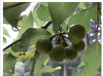
アブラチャンなどの実が大きくなっていく季節です。