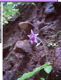
イワタバコの花が咲いていました。