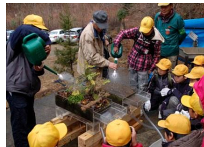
水源林の仕組みの実験

2月26日、川崎市立日吉小学校の5年生、先生、保護者135名がやどりき水源林を訪れ、森林インストラクターから水源林の働きを学習した後、見本林や冬芽等の観察を行いました。