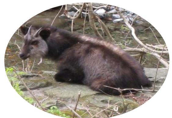
ニホンカモシカ 林道コースの堰堤にて(2009年3月)