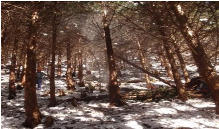
雪煙を上げて倒れる木（後沢乗越付近）

2月14日、やどりき水源林森の案内人動物班の皆さんが雪に覆われた水源林の中でムササビ・モモンガの巣箱調査を行いました。