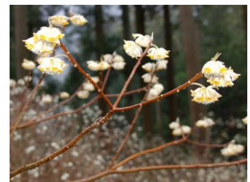
ミツマタ 平成20・21年度成長の森手前のミツマタの群生です