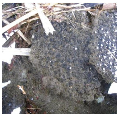
産卵を終えたヤマアカガエルとその卵(2010年2月26日)