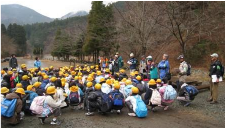
集会棟前広場で始めの会