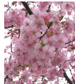
満開のカワヅサクラ 国道246号の寄入口信号から入って暫く行った集落付近です