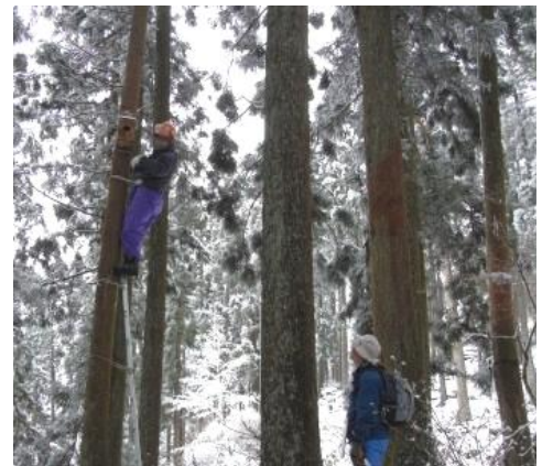
梯子に登ってムササビ・モモンガの巣箱調査(平成21・22年度成長の森付近)

2月6日、かながわ森林インストラクターの会主催で間伐大会を開催しました。当日は会、林野庁研究保全課、県森林課、日揮（水源林パートナー企業）の皆さん約50名が参加し、後沢乗越付近で積雪の中森林整備を行いました。