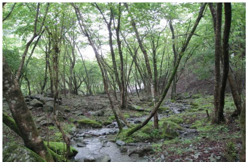
心和む寄沢の溪畔林とせせらぎの風景