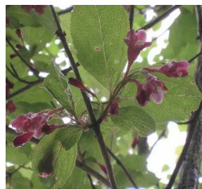
ベニバナニシキウツギ