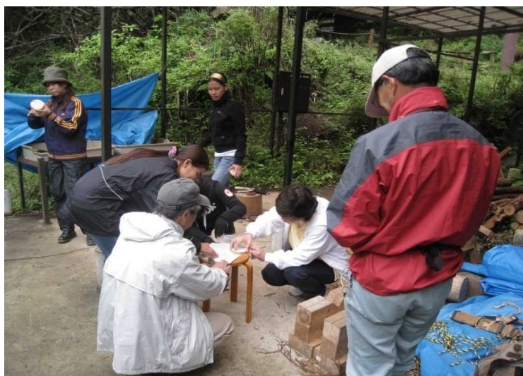
コースター作りに熱中