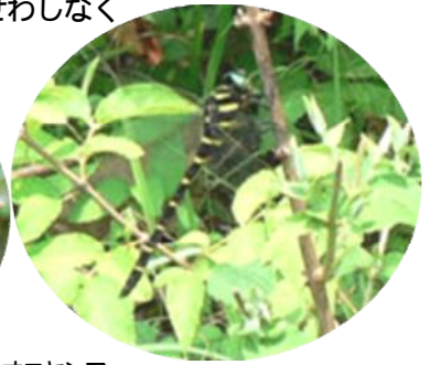
左から ミヤマクワガタ(オス)、カラスアゲハ、ルリタテハ、フクラスズメ(幼虫)、オニヤンマ