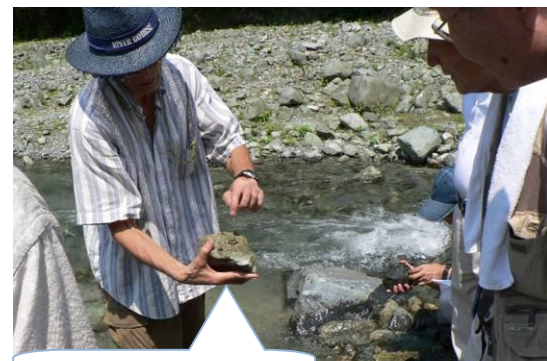
川底の石の表面にもいますよ

夏本番! 水源林は気温も市街地より2~3 低く、寄沢のせせらぎや森をわたる風が心地よく感じられます。子どもたちが沢や森で、思い思いに夏を楽しみ自然と親しむよい機会です。 定例観察会の案内人は夏の自然を皆様にお伝えするために研修をしました。 <安全に自然を楽しむために> 沢に入るときは脱げにくい靴か長靴をはく 子どもから目を離さない(意外に親が夢中になるようです) 日射、熱射病に注意(着帽と十分な水分補給)