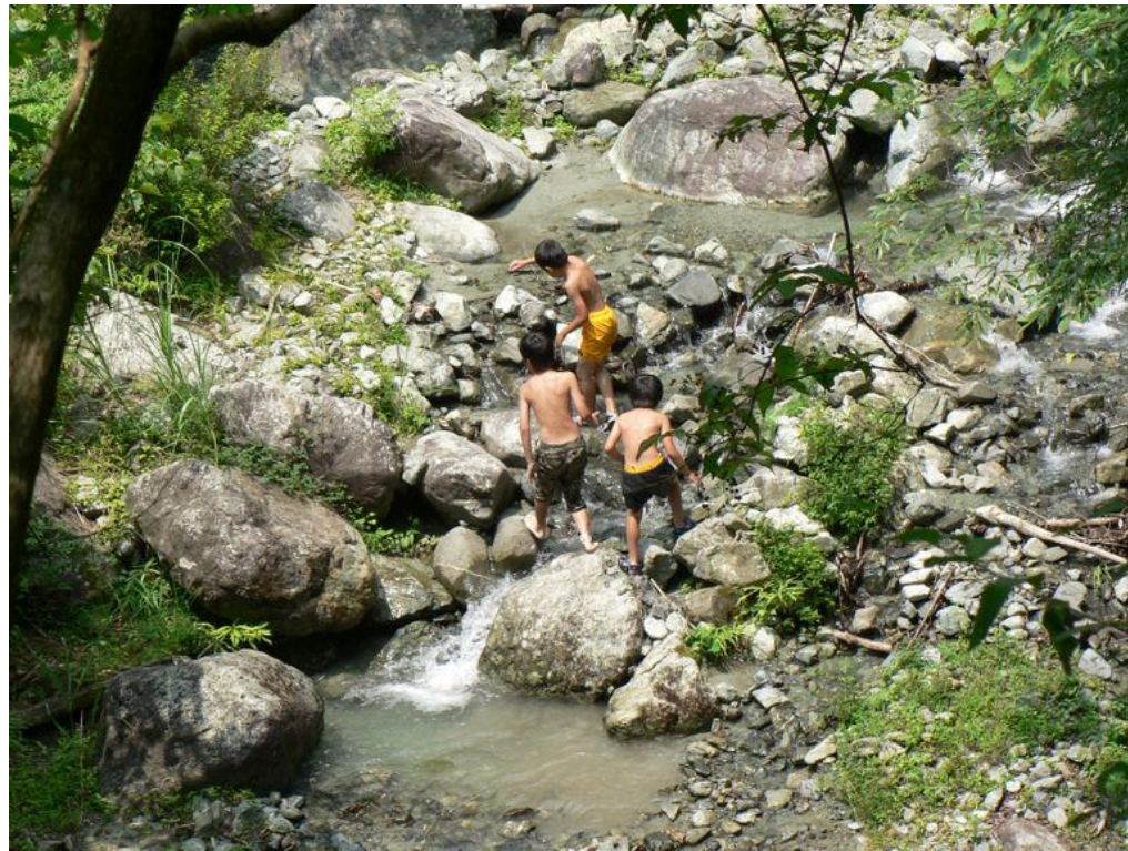
夏休みになって寄沢で遊ぶ子どもたち「気をつけてね!」と声をかける

夏本番! 水源林は気温も市街地より2~3 低く、寄沢のせせらぎや森をわたる風が心地よく感じられます。子どもたちが沢や森で、思い思いに夏を楽しみ自然と親しむよい機会です。 定例観察会の案内人は夏の自然を皆様にお伝えするために研修をしました。 <安全に自然を楽しむために> 沢に入るときは脱げにくい靴か長靴をはく 子どもから目を離さない(意外に親が夢中になるようです) 日射、熱射病に注意(着帽と十分な水分補給)