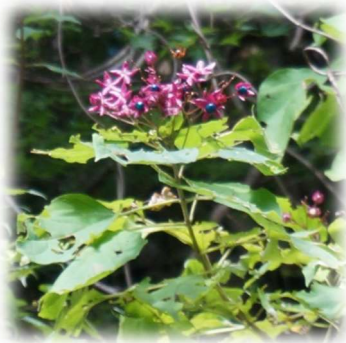
鮮やかな紫 クサギの実