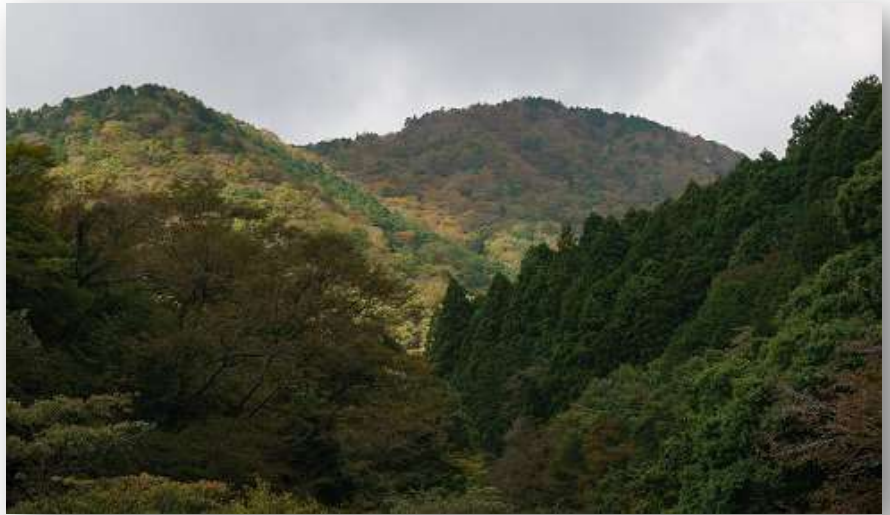
ようやく色づき始めた山々