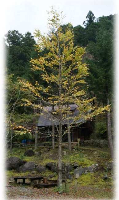
落ち葉が甘くこうばしい香りのカツラの木