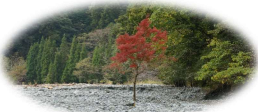
沢にはぽつんと1本もみじ