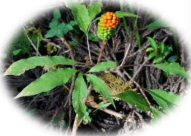
やっと半分赤くなった実 テンナンショウの仲間