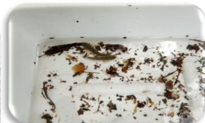
カジカ・プラナリアなど 清流に棲む生き物たちが 沢山見つかりました