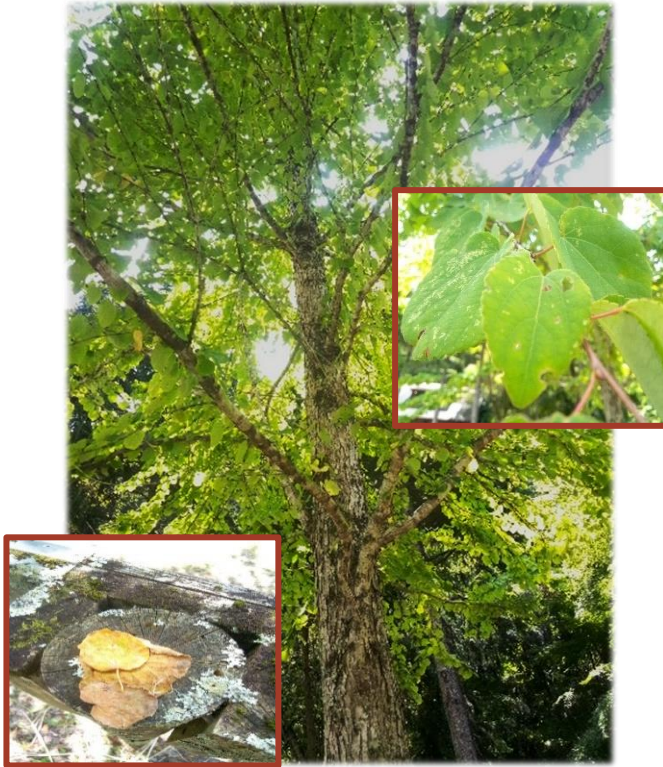
甘い香りの正体はカツラの葉