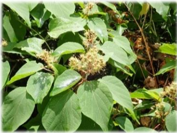
アカメガシワの花も 咲いています

カツラの木のハート形の葉からは何とも言えない甘い香りが漂い リョウブの木には満開の花が咲いています。この花からはミツバチの力をかりて、 香りの高いとても貴重なハチミツが採取されるそうです。 ススキの葉裏には小さな生物が、クロコノマチョウの幼虫です。その愛らしい目と動きにもう釘付け 皆様も森の案内人と一緒にやどりきの森で沢山の発見をしてみませんか！