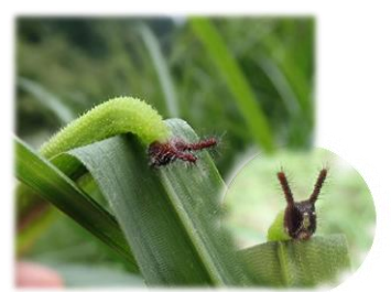
クロコノマチョウ の幼虫・どんな姿 に変身して舞うの でしょう。