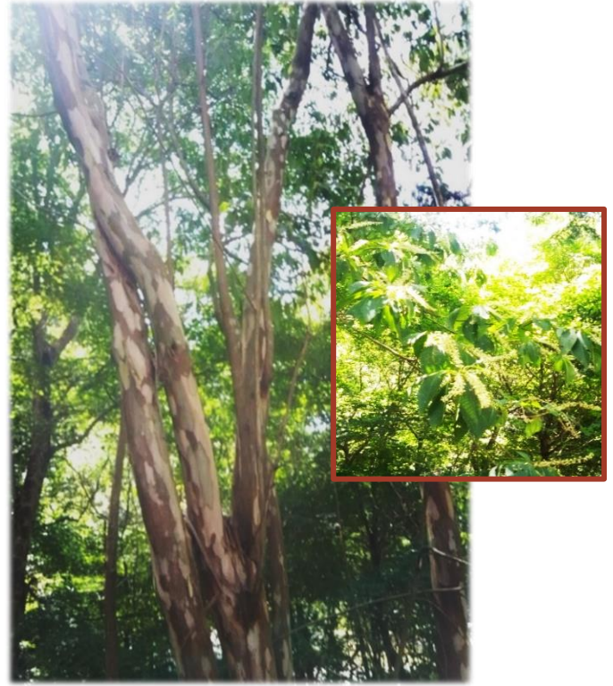
リョウブの木にも満開の花

カツラの木のハート形の葉からは何とも言えない甘い香りが漂い リョウブの木には満開の花が咲いています。この花からはミツバチの力をかりて、 香りの高いとても貴重なハチミツが採取されるそうです。 ススキの葉裏には小さな生物が、クロコノマチョウの幼虫です。その愛らしい目と動きにもう釘付け 皆様も森の案内人と一緒にやどりきの森で沢山の発見をしてみませんか！