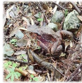
アズマヒキガエルが沢へ ジャンプ寸前