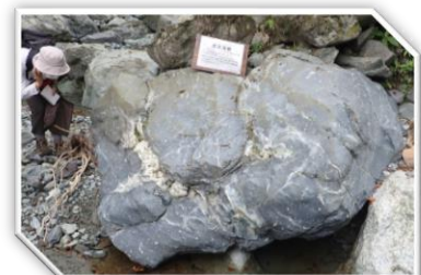
丹沢が海底火山であった証拠の枕状溶岩です