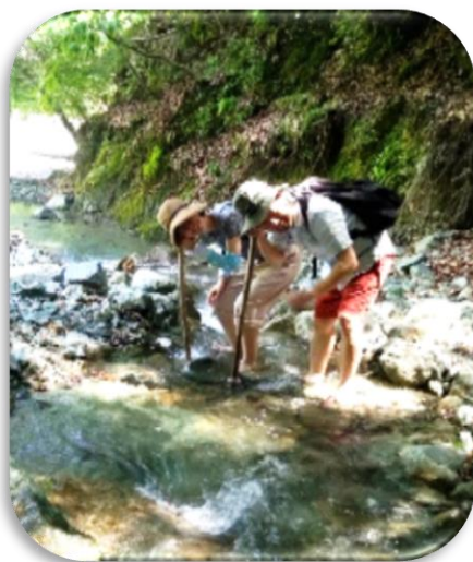
木伝導越しの水の調べにご夫妻も感動

訪れるたびに驚くほどの発見があるやどりき水源林 木伝導越しの水音に耳をすませ贅沢な時間を過ごします。 森の案内人と一緒に水の中の生き物を探すと、カジカ・ オタマジャクシ・プラナリアなど清流に棲む沢山の生物に 出会えました。