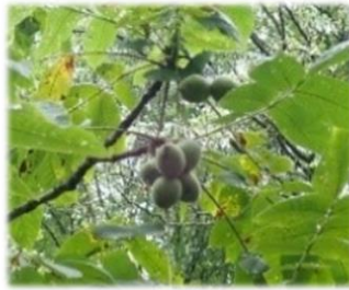
オニグルミの木には 実がたわわ・誰のお 腹を満たすかな？